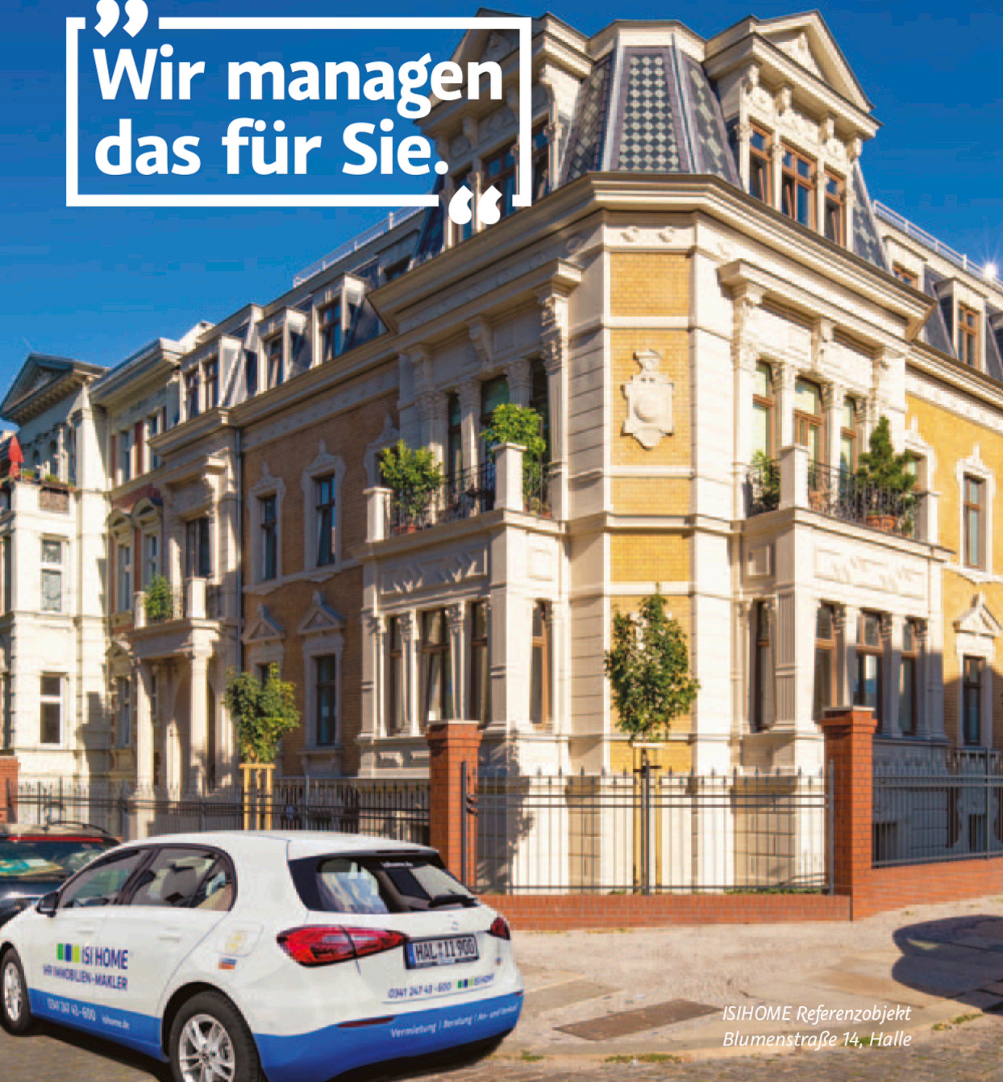
ISIHOME Referenzobjekt Blumenstraße 14, Halle