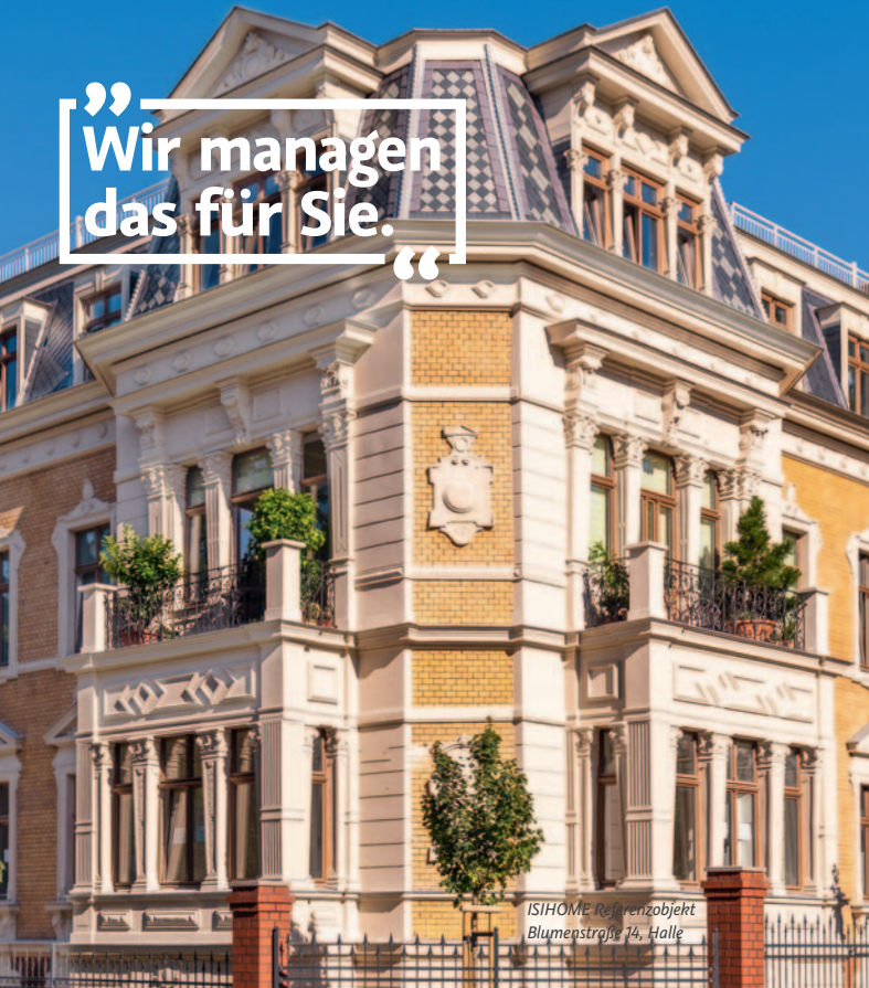
ISIHOME Referenzobjekt Blumenstraße 14, Halle