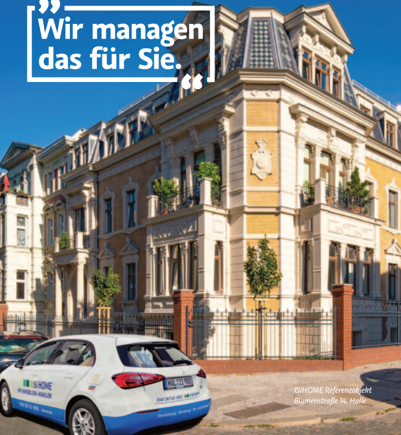
ISIHOME Referenzobjekt Blumenstraße 14, Halle